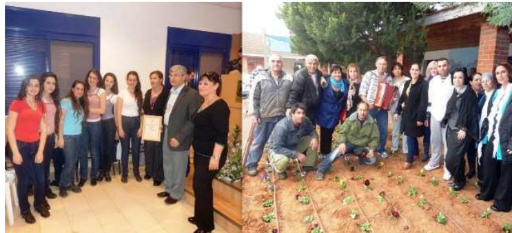
מפגן אהבה לטבע ולסביבה.

עשרות מטופלים וצוות ביה"ח במפגן אהבה לטבע ולסביבה. נטיעות בלויז אקורדיוניסט, מסיבה מושקעת עם אומנים אורחים וכיבוד עשיר ע"פ מסורת החג. ככה חוגגים במקום שזוכה מדי שנה לחמישה כוכבי יופי בתחרות א"י. יפה. כמיטב המסורת ועם הרבה שמחה בלב נחגג חג הט"ו בשבט בביה"ח שער מנשה.